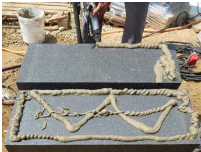
Rendszerragasztó gépi felhordása W-séma szerint

Gépi felhordás esetén a táblák hátoldalára W-séma szerint visszük fel a rendszerragasztót.