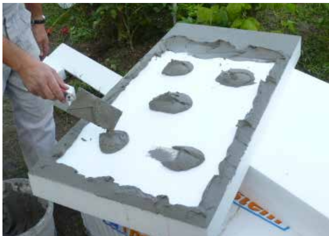
Rendszerragasztó kézi felhordása pont-perem módszerrel

Kézi felhordás esetén a ragasztót a polisztirol hőszigetelő tábla hátsó oldalára "pont-perem" módszerrel hordjuk fel oly módon, hogy a ragasztó fedje körben a tábla hátsó szélét és még 5 pontban borítsa a hátsó oldalát.